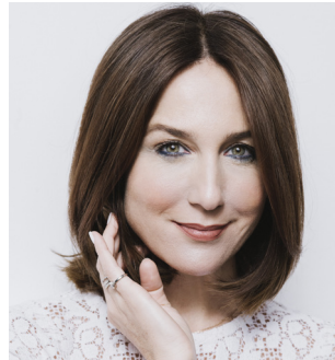
ELSA ZYLBERSTEIN invitée d'honneur française