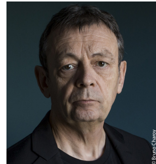
PIERRE LEMAITRE président français du jury

La sixième édition de Champs-Élysées Film Festival, qui se tiendra du 15 au 22 juin 2017, sera présidée par le réalisateur et producteur américain Randal Kleiser connu notamment pour la réalisation de Grease , succès mondial, et l'écrivain français Pierre Lemaître , lauréat du Prix Goncourt 2013 pour Au revoir là-haut adapté par Albert Dupontel et en salles en octobre 2017. Ils seront entourés d'un jury composé de :