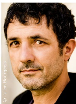
ALBIN DE LA SIMONE