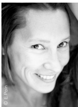
EMMANUELLE BERCOT PRÉSIDENTE

La sélection officielle sera révélée le 8 juin.