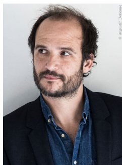
Thomas Lilti Président du Jury